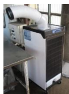
スポットクーラー