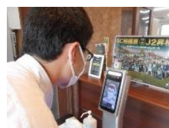
体温測定 AI サーマルカメラ