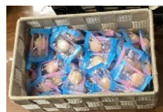
塩飴・塩タブレット