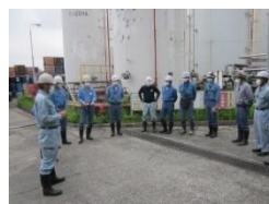
始業前ミーティング