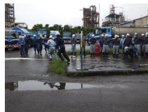
川崎工場 (左)事務棟3階へ避難 (右)消防訓練