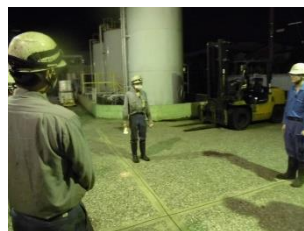
横浜工場 (左)工場屋上へ避難 (右)夜間訓練 点呼