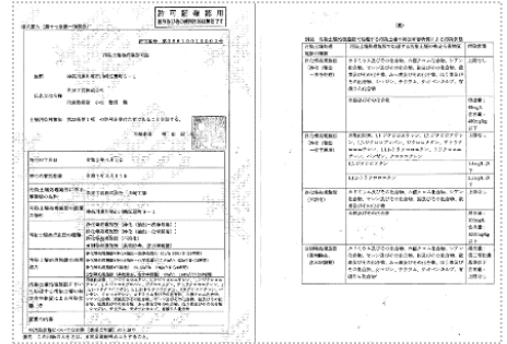
汚染土壌処理業許可証（川崎市） 有効期限 令和7年3月31日

今回の更新で VOC の処理方法が熱脱着から化学脱着へ変更になりました。より確実な処理を実現致します。汚染土壌について、お困りの際は、ぜひ三友グループまでご相談ください。