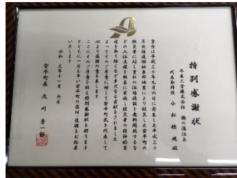
安平町より特別感謝状