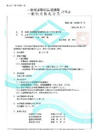
一般産業廃棄物処分業(横浜市)

本事業は、スターバックスコーヒー ジャパン株式会社の店舗から発生するコーヒー豆かすを乳酸菌発酵させ、乳牛用の飼料にリサイクルしています。事業開始から6年経ち、リサイクル量(累計)は約4,000tになりました。今後もしっかりと食品リサイクル事業を継続してまいります。