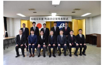
令和元年度町政功労賞等表彰式