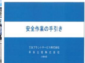
安全作業の手引き