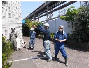
手信号による伝言リレー

安全作業教育では、安全作業や緊急時の避難場所の確認、資機材の点検等について教育を行いました。また、スマホサイズの「安全作業の手引き」を作成し、協力会社を含む川崎構内社員全員に配布しました。